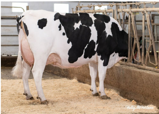
OCD LEGENDARY RAE THIRD DAM